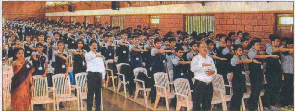
ಮಂಗಳೂರಿನ ಸಹ್ಯಾದ್ರಿ ಕಾಲೇಜಿನ ವಿದ್ಯಾರ್ಥಿಗಳು ಬುಧವಾರ ಮತದಾನದ ಪ್ರತಿಜ್ಞೆ ಸ್ವೀಕರಿಸಿದರು.

ಎಲೆಕ್ಟ್ರಾನಿಕ್ ಮತದಾನ ಯಂತ್ರ (ಇವಿಎಂ) ಮತ್ತು ಚುನಾವಣೆಗೆ ಸ್ಪರ್ಧಿಸುವ ಅಭ್ಯರ್ಥಿಗಳ ಬಗ್ಗೆ ತಪ್ಪು ಇಲ್ಲದೇ ಇರುವಾಗ ಮತದಾರರಿಗೆ